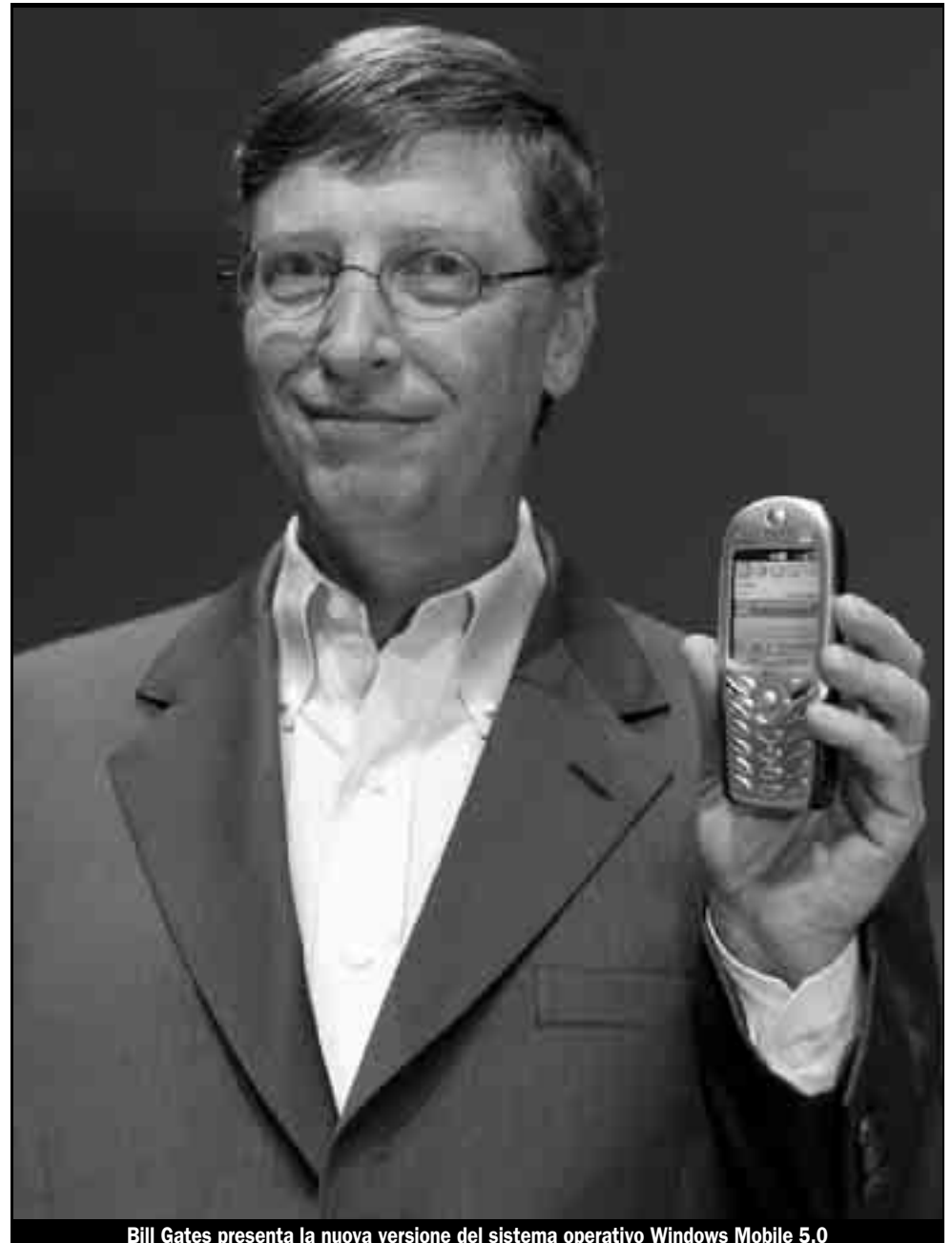
Bill Gates presenta la nuova versione del sistema operativo Windows Mobile 5.0