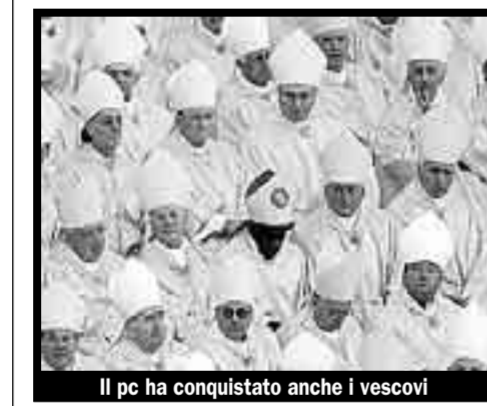
Il pc ha conquistato anche i vescovi

I vescovi italiani non hanno paura di internet. In particolare i trenta vescovi e cardinali membri del Consiglio permanente della Cei usano regolarmente intranet, la rete virtuale che collega tra loro le diocesi, per scambiarsi messaggi e ricevere informazioni, in particolare le rassegne stampa e le notizie dal Sir e dalle altre agenzie. «E se non si mettono direttamente davanti al computer, quantomeno si fanno aiutare. Intranet è importante per tutti